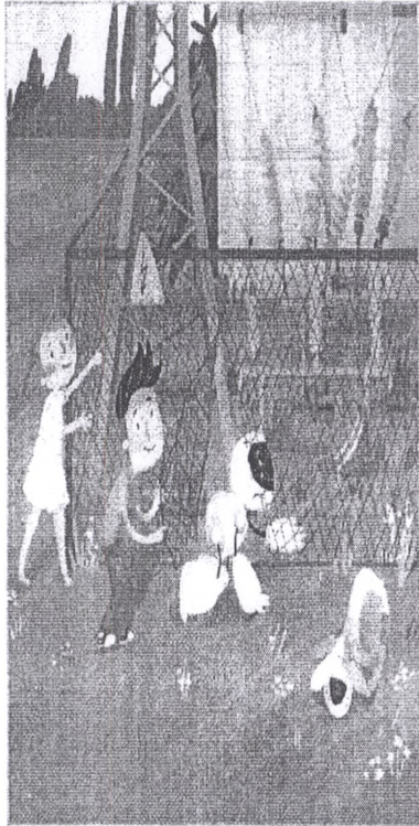
Стоять! Не придумывай, как достать или проникнуть. Позови взрослых!