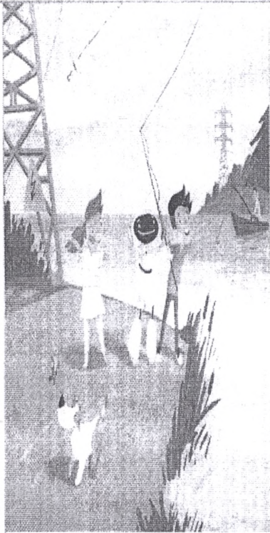
Нельзя играть и ловить рыбу рядом с линией электропередачи!